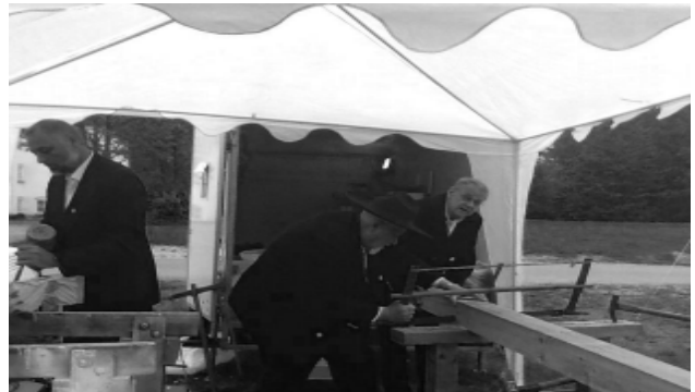
Andelslandsbyen Nyvang i Holbæk.