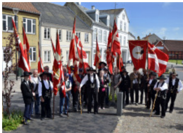
Fanerne pinsen 2015