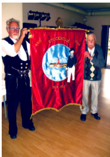
Stockholm har fået ny fane / banner