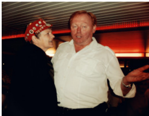
Vi kører som sagt 25.aug. - 29.aug. 2016