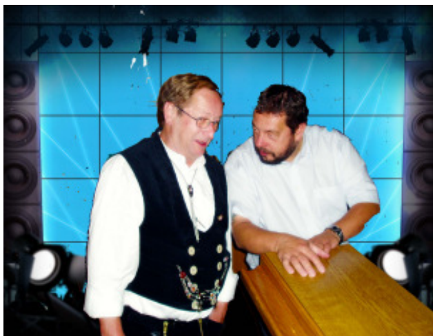
Mon der er nogen der skal med til Mosel i år?