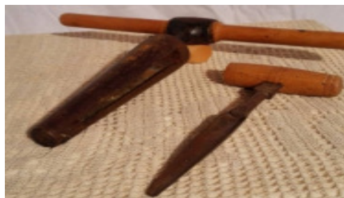
Bor til spuns og taphul.

Herefter skal karet drives sammen, og dertil bruges to eller flere bånd, de er midlertidige, og kaldes ofte for rejsebånd , karet rettes nu til, og drives hårdt sammen, så det er til at håndtere. Karets ender skal nu rettes af, dette gøres med båndkniven, og det høvles jævnt på indersiden. Den næste opgave er nu at skære den rille hvor karets bund skal sidde, den kaldes en krøsgang , og til dette bruges et stykke speciel værktøj der kaldes en krøs , så skal bunden tildannes og skæres ud. Bunden består af flere stykker, de skal stryges ophyggelet sammen på strygehøvlen, og bliver samlet med trædyvler, eller jernstifter, når bødkeren har beregnet radius af bunden mærkes denne op, og saves ud med svejsav , hvorefter den høvles plan, og kanten skæres skrå til med båndkniven så den passer i krøsningsens brede. Nu fjernes det nederste jernbånd, og bunden presses på plads i krøsningsen, hvis den passer drives det nederste bånd på plads igen.