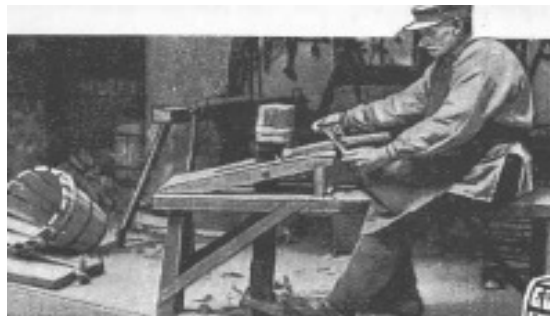
Bødker ved sin bænk.

På værkstedet bliver træet udkløvet, og stærkt vindskæve stykker rettes til med øksen, herefter foregår den videre forarbejdning af stave, ved hjælp af bødkerens vigtigste redskaber, nemlig båndknivene en retekkniv og en krumkniv, og bødkeren tilbringer det meste af vinteren ved sin skærebænk, med at fremstille stave hvor de får den første ydre runding, og indersiden hules ud, og spidnes til på siderne. De stykker der skal bruges til bundtræ, rettes til så de har ens tykkelse over alt.