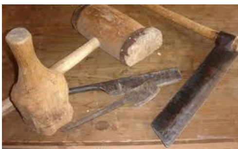
Kløvekniv og trækøller.

Råmaterialet er træ, og de foretrukne sorter er eg, ask, bøg og fyr, og som tøndebånd anvendes foruden jern også pil og hassel. Bødkeren ønsker træ af en god kvalitet, og foretrækker selv at fælde det, det skal være retvokset, og også helst vokset i skygge, de giver smalle årringe og dermed stærkere ved. Fældningen skal helst foregå omkring årsskiftet, og træet bliver straks skåret op i de gængse længder.