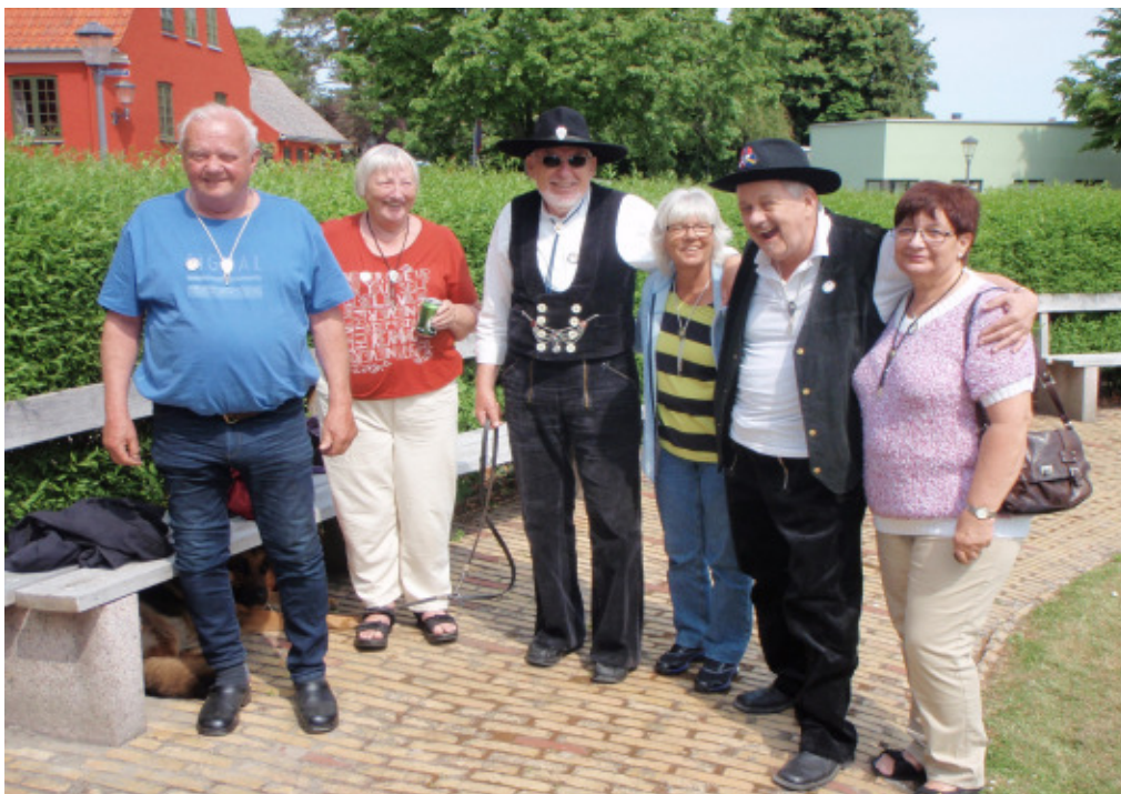
Gruppenfoto Skælskør. Pinsen 2017 „Dem der mødte til tiden“