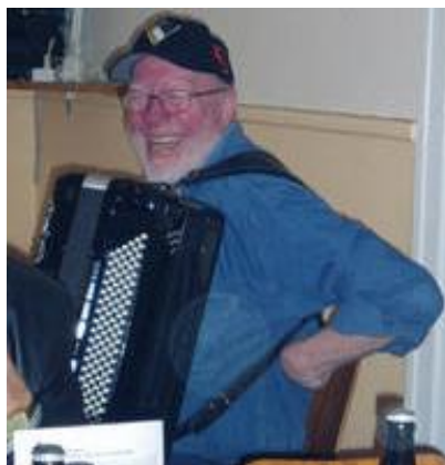
Indsendt af Spilleman- den fra Herning Haldur Ham selv