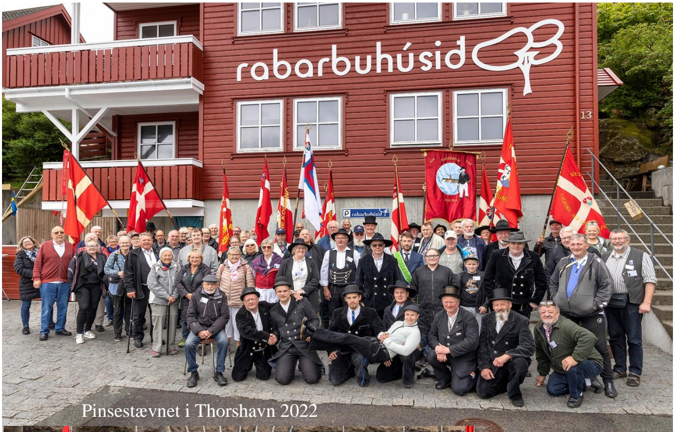
Pinsestævnet i Thorshavn 2022