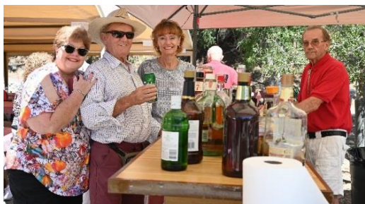
Naver Bar is open.

I november forsætter vi festlighederne med Morsensaften Andesteg og i December bliver det flæskesteg til julemiddagen, som var vi alle igen tilbage i Danmark.