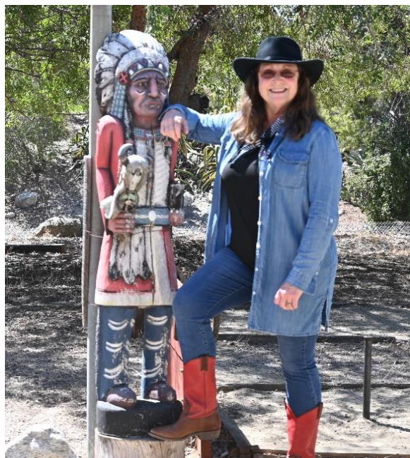
Indian Chief & a Naver Cowgirl

Vi kan mærke klimaskiftet, da det ofte er meget varmt omkring 35C grader, og kun lidt regn. Men vi nyder hinandens samvær - og snakker Dansk.