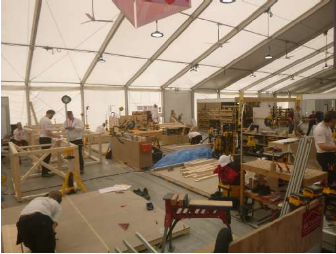
Tømrer på SKILLS