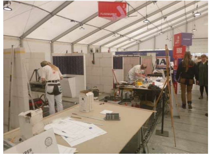
Flise-murer på SKILLS

Bl.a. hos murer, slagter og skov- og naturtekniker, men der, hvor der var mest interesse i år, var hos bådebyggerne og mejeristerne.