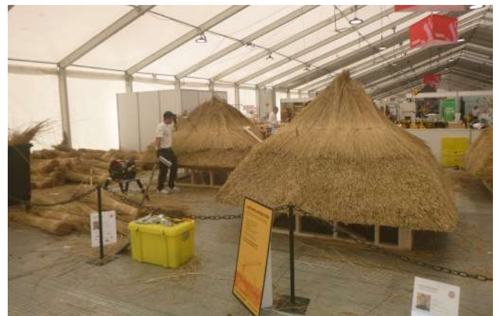
Tækkemand på SKILLS